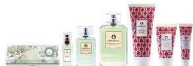
奢寵香水皂/淡香水/香水身體乳液/奢寵香水護手霜