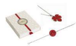
貴族鑽石項鍊 / 無花果手鍊