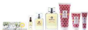
奢寵香水皂/淡香水/香水身體乳液/奢寵香水護手霜