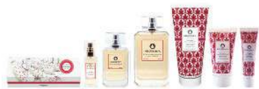
奢寵香水皂/淡香水/香水身體乳液/奢寵香水護手霜